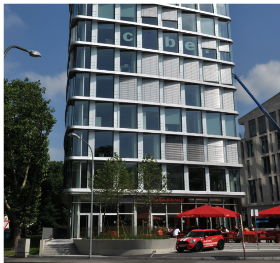
Die Ciber Managed Services GmbH in Freiburg.

„Wissensbilanz – Made in Germany“ finden Sie unter: www.akwissensbilanz.org www.wissenmanagen.net www.bvwb.org